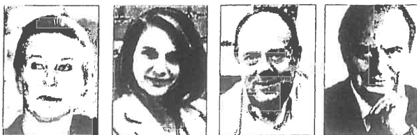
Maria Gabriella di Savoia; Paola Pitagora; Carlo Verdone e Bruno Vespa.